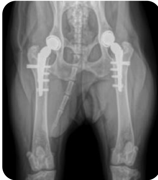
Prothèse totale de hanche