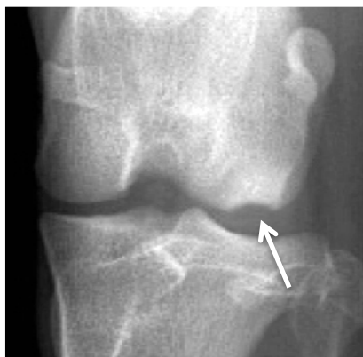
Ostéochondrite disséquante du genou

Les signes sont souvent visibles entre 4 et 10 mois d'âge. Une boiterie d'appui du membre affecté apparaîtra puis s'aggraver. Elle sera souvent plus marquée après l'exercice et moindre lors de période repos.