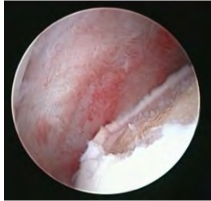
Lésion ostéochondrite disséquante