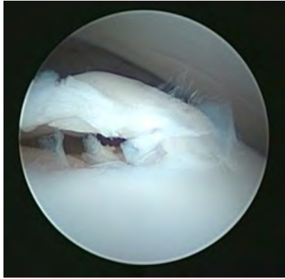
Flap de cartilage